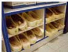
botníky a obuv