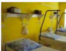
JIP a pooperační pokoje

Dezinfekční účinnost: BAKTERICIDNÍ včetně MRSA, FUNGICIDNÍ, široké spektrum VIRUCIDNÍ, MYKOBAKTERICIDNÍ a TUBERKULOCIDNÍ.