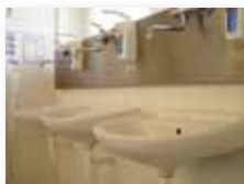
vodovodní baterie a odpady